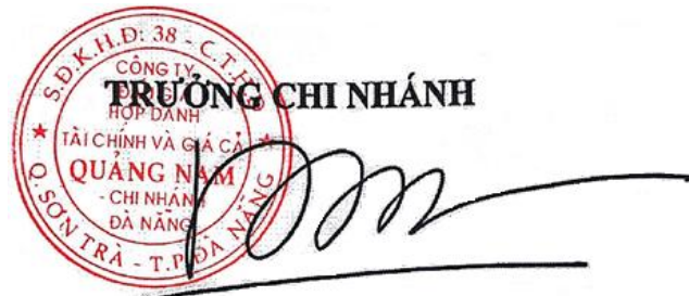
Hồ Ngọc Đồng