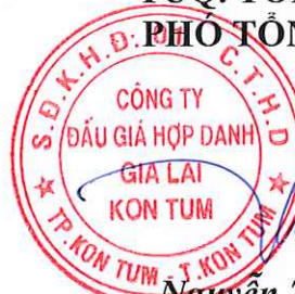
Nguyễn Thị Tuyết Trâm